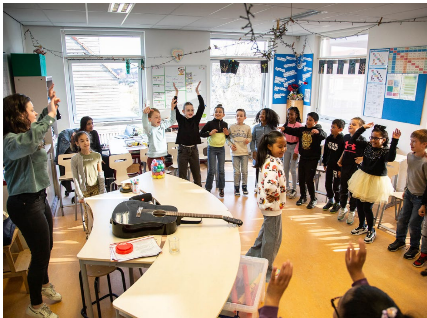
Ontwerp: Endigoo

directeur-bestuurder Stichting Leerorkest Nederland Stichting Instrumentendepot Leerorkest Stichting Muziekcentrum Zuidoost